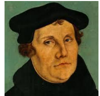
Martin Luther (1483 - 1546)

Au début du XVI ème siècle, Martin Luther , un moine allemand, propose une réforme de la religion catholique qui refuse l'autorité du pape. Il crée alors une nouvelle religion : le protestantisme 1) . Ses idées se répandent en Allemagne et en Europe du Nord.