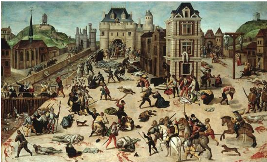
Le Massacre de la Saint-Barthélémy , 1582, François Dubois

En août 1572, de nombreux protestants sont rassemblés à Paris pour assister au mariage de la sœur du roi catholique (Charles IX) avec le prince protestant Henri de Navarre. Le 24 août , jour de la Saint Barthélémy , le roi ordonne de massacrer les principaux chefs protestants. Dans les jours qui suivent, plus de 3000 protestants sont tués partout en France.