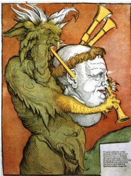
Caricature catholique représentant Luther, le chef des protestants, en cornemuse du diable.