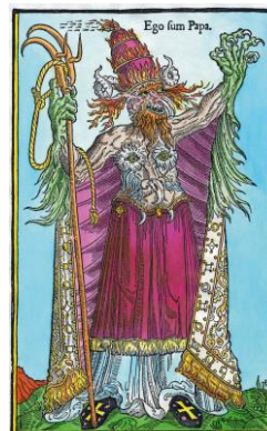
Caricature protestante Le pape des catholiques caricaturé par les protestants.

Essaie de définir une caricature. Quel en est le but ?